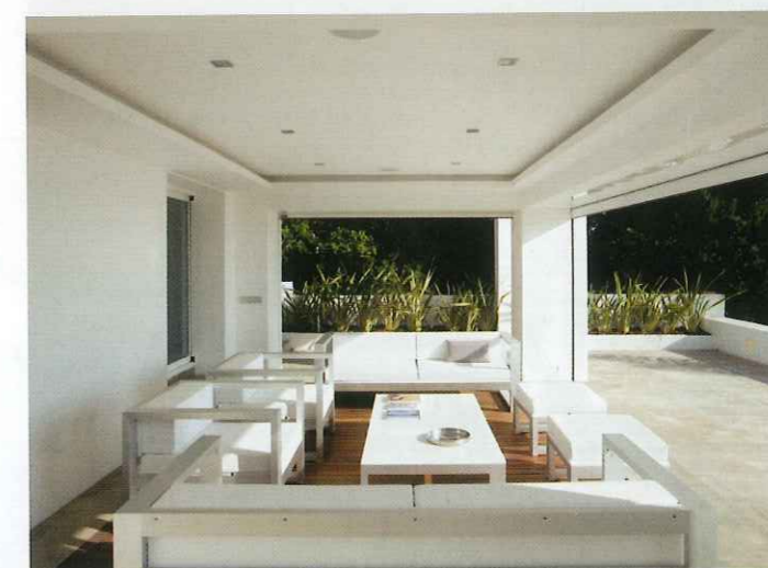
Estilismo y textos: Ana León.

Sobre una colina y mirando al mar se alza esta vivienda reformada que ha experimentado una gran transformación pasando de ser una estructura tradicional de la costa donde predominaba una distribución con bastante tabiquería, sin interrelación de espacios y materiales muy desfasados, a una casa bien distribuida, amplia, adecuada a las necesidades de la joven familia que vive en ella y con un estilo propio elegante y con clase.